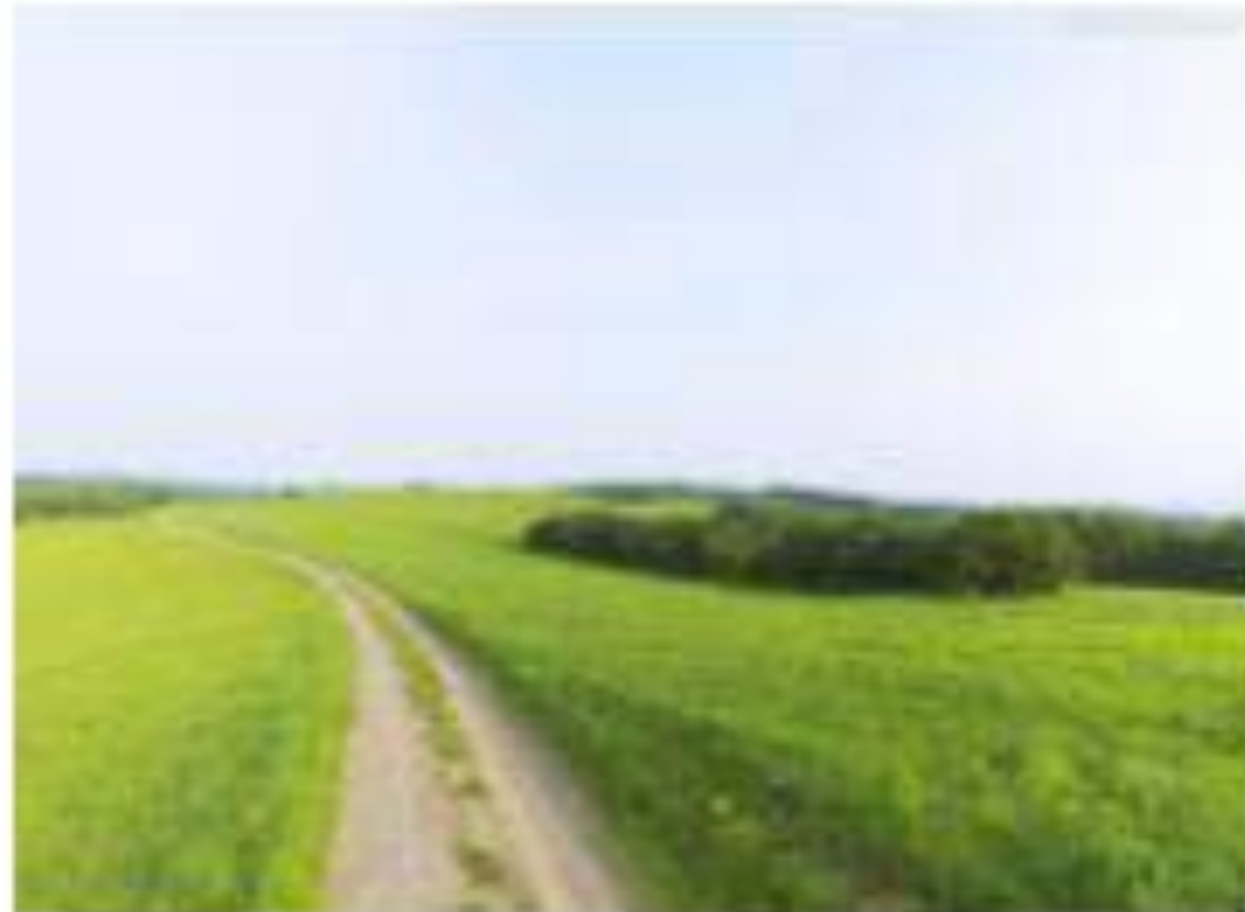
Kampara tera vojo