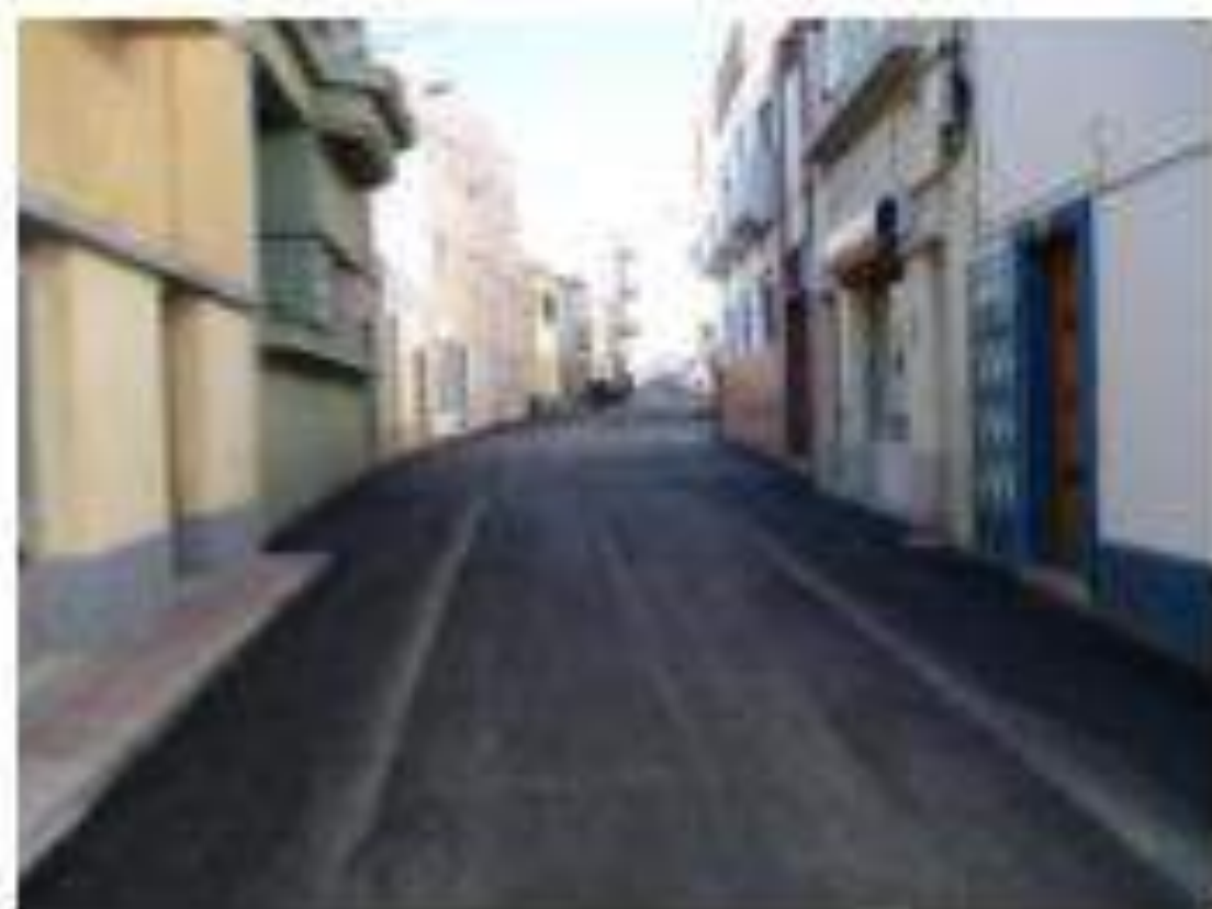
Urba asfaltita vojo